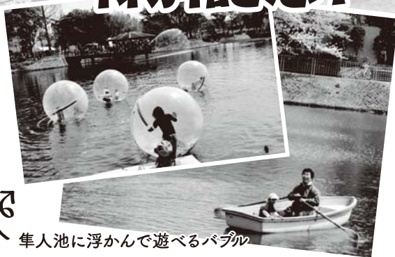
隼人池に浮かんで遊べるバブル

ステージでの出し物・模擬店・いりなか歴史紹介・お花見ピクニックゾーン・ガラガラポン抽選会・隼人池に浮かんで遊べるバブルなど 今年も内容盛りだくさん!